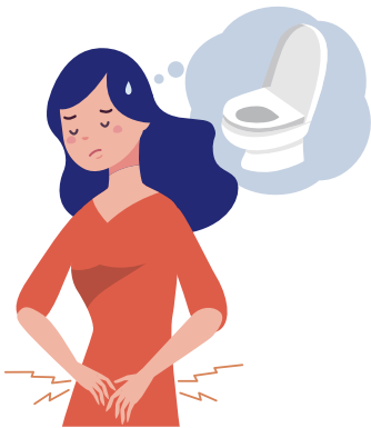
排尿時に痛みがある