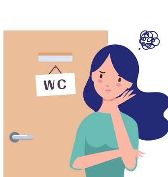
排尿後すっきりしない