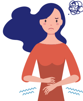
お腹が痛い・ムカムカする