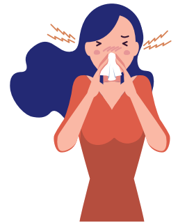
鼻水が出る・鼻がつまる