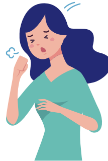
咳や痰がでる・のどが痛む