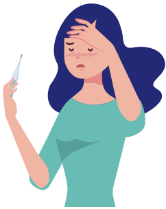
熱がある・悪寒がする