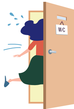
トイレに行く回数が増えた