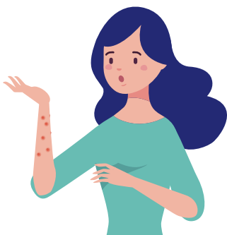
水ぶくれのような発疹ができた