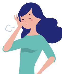
だるい・倦怠感がある